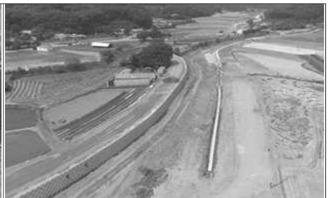
동문천 개수공사 1지구(공사 중)