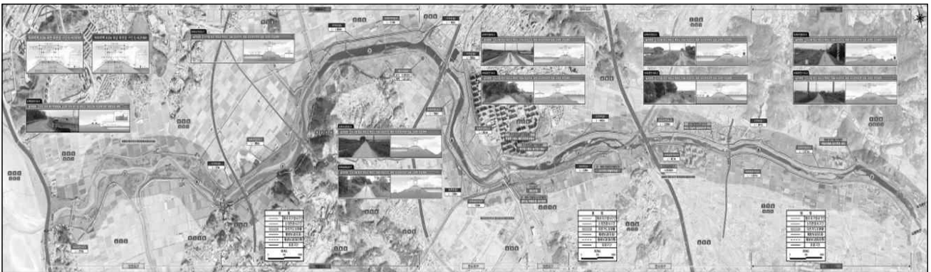
공릉천 하천정비 계획도