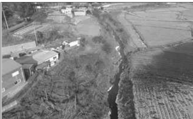
동문천 개수공사 1지구(공사 전)